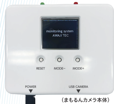
(まもるんカメラ本体)

現状、経鼻胃管時等の抜管対策はミトンなど専用の防止器具の装着、スタッフの見守り強化などの対策のみですが、まもるんカメラを導入することで抜管のリスクを最小限に抑え、医療スタッフの負担軽減と患者の安全を提供します。